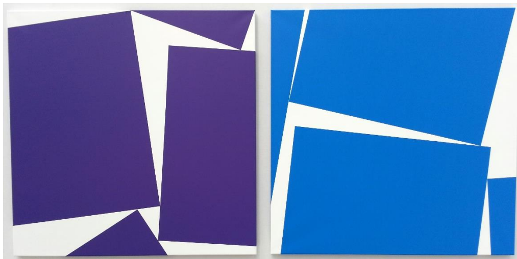
« Lorsque quatre carrés se touchent » - 100 x 200cm - 2012

Et à voir ses angles de carrés colorés sur fonds blancs [diptyque « Lorsque quatre carrés se touchent » et tableaux « Carambolage »], à voir l'hésitation, le flottement qui semble éviter le chevauchement ou à présider à l'échelonnement des surfaces et des couleurs, leur recouvrement, on comprend comment cette recherche a en réalité pour but de faire surgir l'imprévu, la liberté, l'imaginaire. Vera MOLNAR est d'ailleurs une des premières artistes à avoir utilisé l'ordinateur dès la fin des années 60.