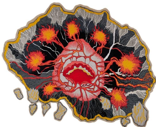
Mundus Subterraneus Magma Hart, 2024 laine tuftée, 190 x 250 cm

Brankica Žilović réinvente la tapisserie en la libérant de ses formes classiques. Elle en fait un médium hybride et vivant, entre dessin, cartographie et sculpture textile. Par la rencontre du fil avec d'autres matériaux, elle transforme chaque point de broderie en geste de mémoire, chaque suture en lien entre l'intime et le collectif. Inspirée par les savoir-faire traditionnels tout en y intégrant des techniques expérimentales, elle confère à ses œuvres une charge sensorielle et politique. Le textile devient alors trace, cicatrice, territoire mouvant.