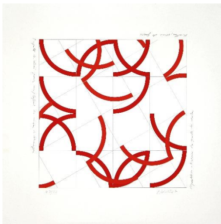
Répartition aléatoire de quarts de cercle, 1993 Sérigraphie sur papier - 60 x 60 cm - n°48/60

la galerie est ouverte du mercredi au samedi de 10h-12h et 14h-18h + mardi sur demande